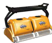
2X2 PRO GYRO