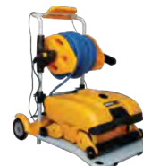
Wave 200 XL