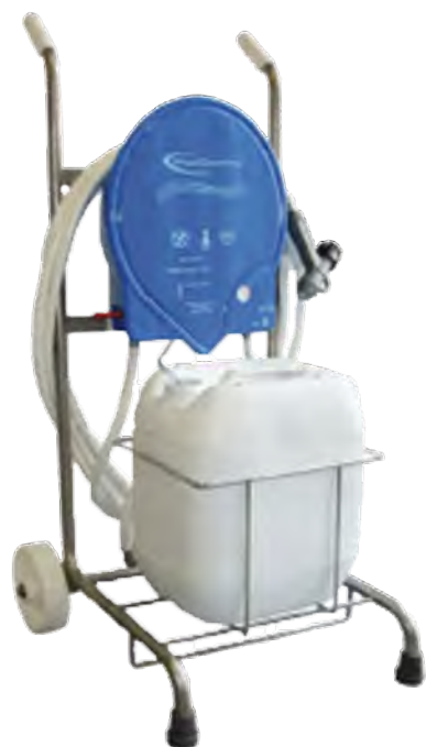
Centrale de nettoyage POOLCLEANING

Destiné au nettoyage intensif et/ou à la désinfection des sols et des surfaces.